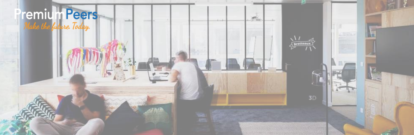
Illustration : projet de déménagement pour un compte du secteur de services